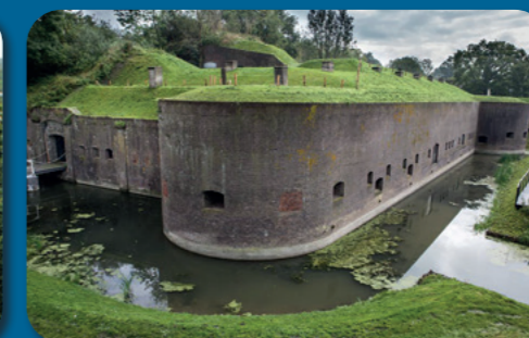
Waterliniemuseum Fort bij Vechten